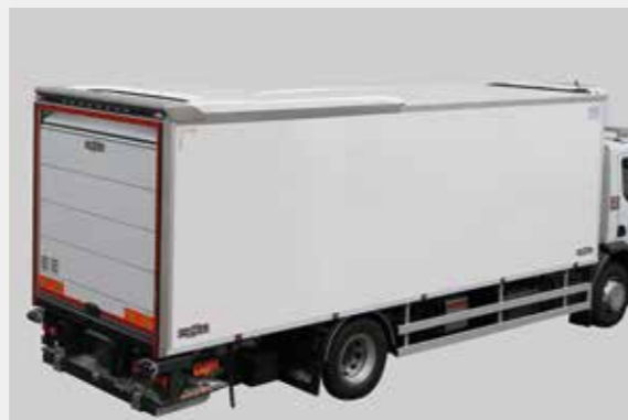
Tractor de 19 toneladas de distribución, provisto de SmartOpen-C