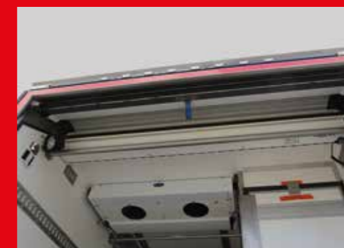
① Techo completamente libre que permite la fácil instalación de una cortina de aire Air Shutter-C y un evaporador trasero