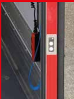
③ Mando externo