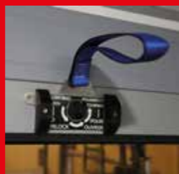
④ Correa antiaislamiento