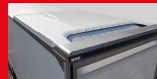
③ Abertura por encima de la carrocería. La suciedad de la carretera queda fuera.