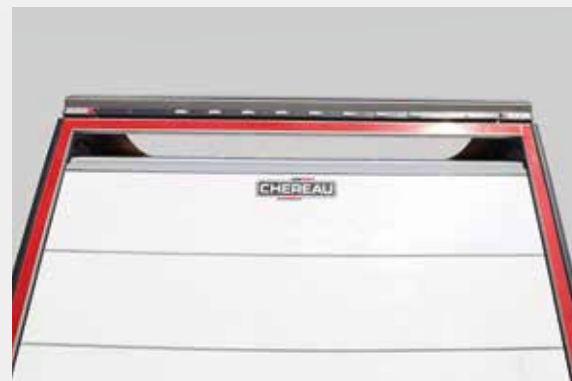
SmartOpen-C es conforme con la etiqueta Piek /CHEREAU QuietCity