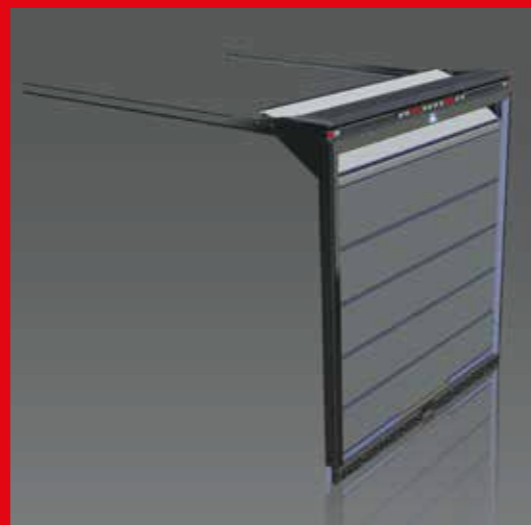
① Marco trasero