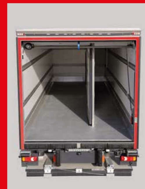
② Aumento de 60 mm en anchura de paso y de 50 mm en altura y en longitud útil en relación con una configuración de cortina